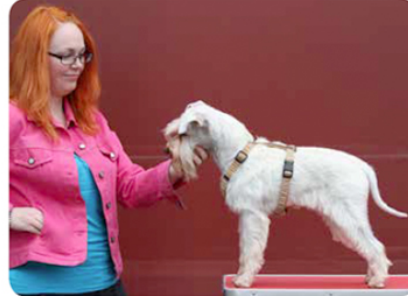
11 Poista koiralta valjaat.