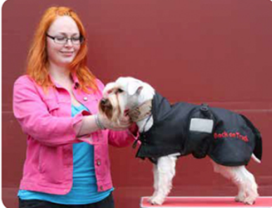
10 Poista koiralta loimi.