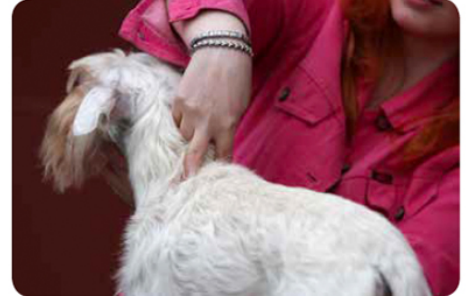
12 Tuomari tunnustelee lapaluiden korkeimmat kohdat sormilla.

Agilitytuomari suorittaa mittauksen seuraavasti: